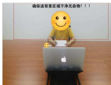
图 2：面试环境示意图