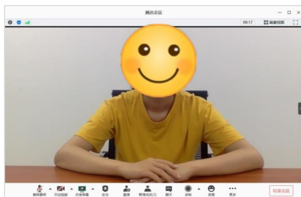
图 3：正面机位视频效果图