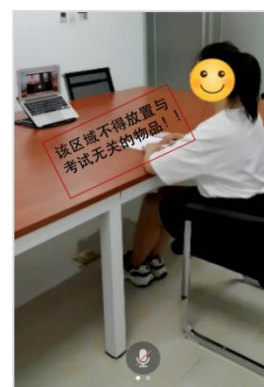
图 4：侧后方机位视频效果图